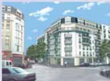
Antony, Avenue Aristide Briand Construction de 34 logements locatifs sociaux et d'une surface commerciale Démarrage des travaux 1 er semestre 2005