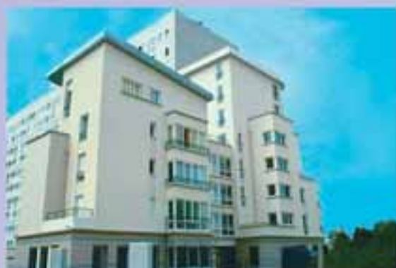
Villeneuve-la-Garenne, rue Saint-Exupéry Construction de 10 logements sociaux et de 2 locaux d'activités Livraison : mai 2004