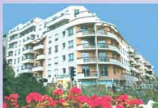
Asnières, Résidence Voltaire : 70 logements locatifs sociaux 24 logements en accession sociale à la propriété (2003)