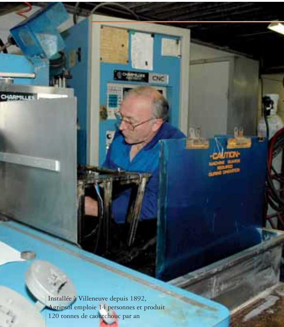
Installée à Villeneuve depuis 1892, Agripsol emploie 14 personnes et produit 120 tonnes de caoutchouc par an