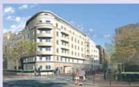
Levallois, rue Edouard Vaillant Construction de 36 logements locatifs sociaux Démarrage des travaux 1 er semestre 2005