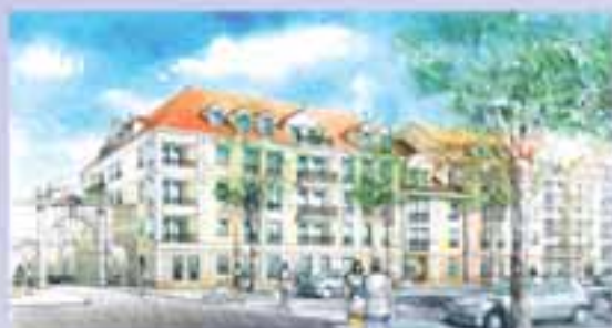
Le Plessis-Robinson, Avenue Aristide Briand Construction de 51 logements locatifs sociaux Démarrage des travaux 1 er semestre 2005