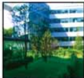
Jardin sur dalle